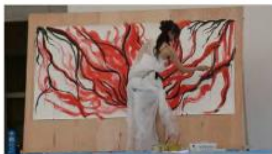
《プロによるパフォーマンス》