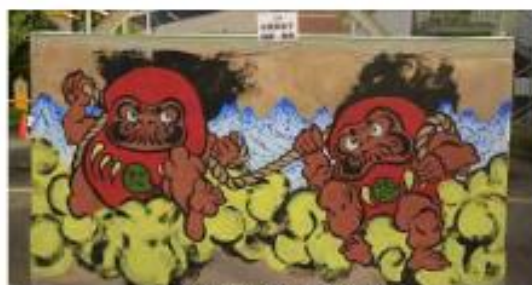
《グランプリの作品》