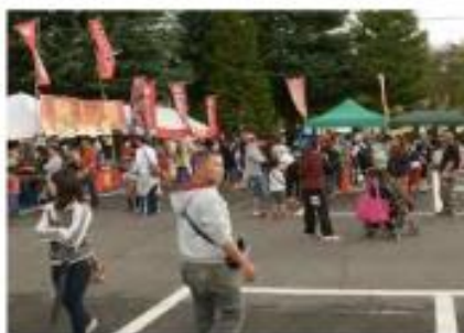
《グルメコーナー風景》