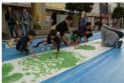
《子どものペインティング》